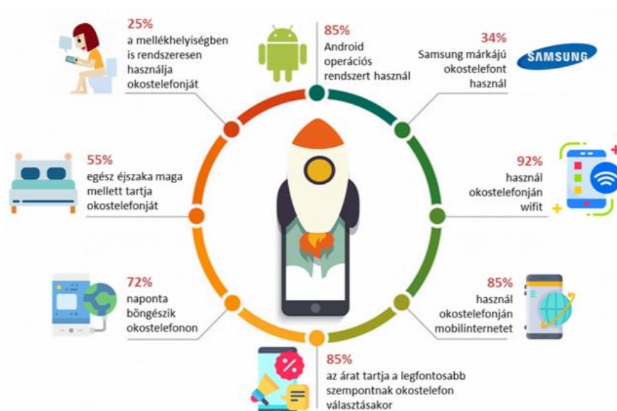
2. ábra Az okostelefon-használat főbb jellemzői Forrás: eNET online kutatás, 2019. május, VeVa online kutatási közösség, N=945 fő, okostelefon-használók Képek forrása: Free Vectors by pngtree.com, https://pngtree.com/ Icons made by Freepik from www.flaticon.com

A vizsgálatban részt vevő országok között azért nagy különbségek tapasztalhatók, mert míg Ukrajnában csak 51 százalék netezik mobilról, addig Szaúd-Arábiában ez az arány 96 százalékos. A Google a magyar felhasználókat is megkérdezte, akik közül összesen 65 százalék szokott okostelefont használni, ami kis növekedést jelent a 2016-os 61 százalékhöz képest. Ráadásul közülük 62 százalék válaszolta 2016-ban, hogy legalább olyan gyakran csatlakozik internetre mobilról mint számítógépről, ami egészen kiugró eredmény az azt megelőző 2015 előtti 52 százalékhöz vagy éppen a 2013-as 22 százalékhöz viszonyítva. A 2016-os összefoglalóban még arról írt a jelentés, hogy a mobil már nem számít másodlagos eszköznek, de a 2017-es eredmények azt bizonyítják, hogy a mobil igazából az elsődleges.